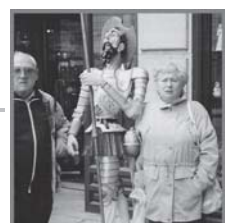
Illustration by Aleksandr Kushner