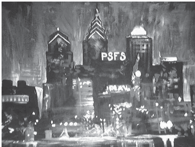
Illustration by Rita Brodsky