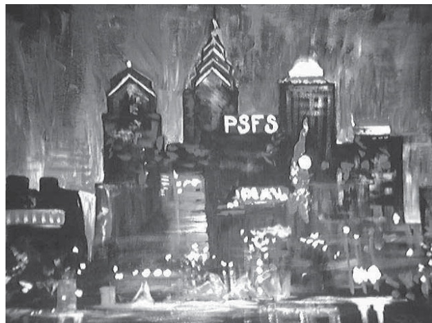
Illustration by Rita Brodsky